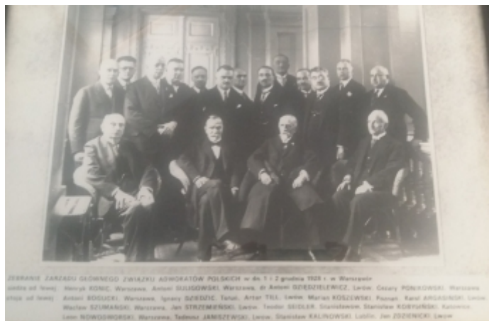
Zebranie Zarządu Głównego ZAP, 1-2 grudnia 1928 r. Warszawa